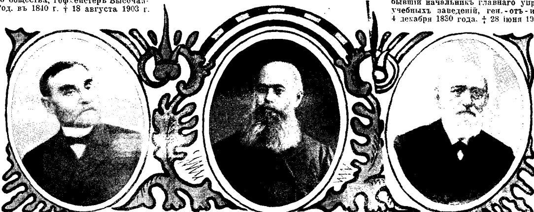
Т. В. Барсовъ † 7 января 1904 г.

округа, состоявший по полевой пѣшей артиллерии, генераль-лейтенантъ. Родился 26 января 1815 г. † 18 мая 1901 г.