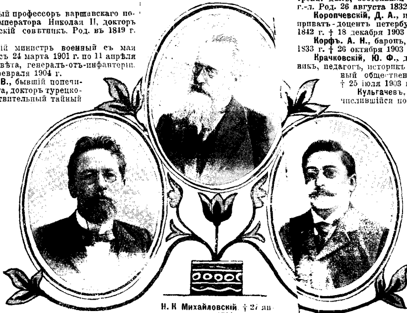
А. П. Чеховъ † 2 июля 1904 г.

Невдъ, Н. В. , известный русский художникъ, академикъ. Род. в 1830 г. † 3 мая 1904 г.