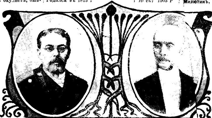
А. П. Энгельгардтъ † 22 ноября 1903 г.

Невдъ, Н. В. , известный русский художникъ, академикъ. Род. в 1830 г. † 3 мая 1904 г.