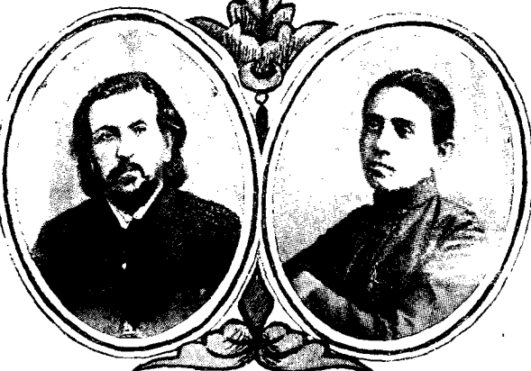
М. П. Бѣляевъ † въ декабрь 1903 г. П. А. Стрепетова. † 5 октября 1903 г.

Юргенсонъ, П. И., извѣстн. музыкальный из- датель. Род. въ 1836 г. † 20 декабря 1903 г.