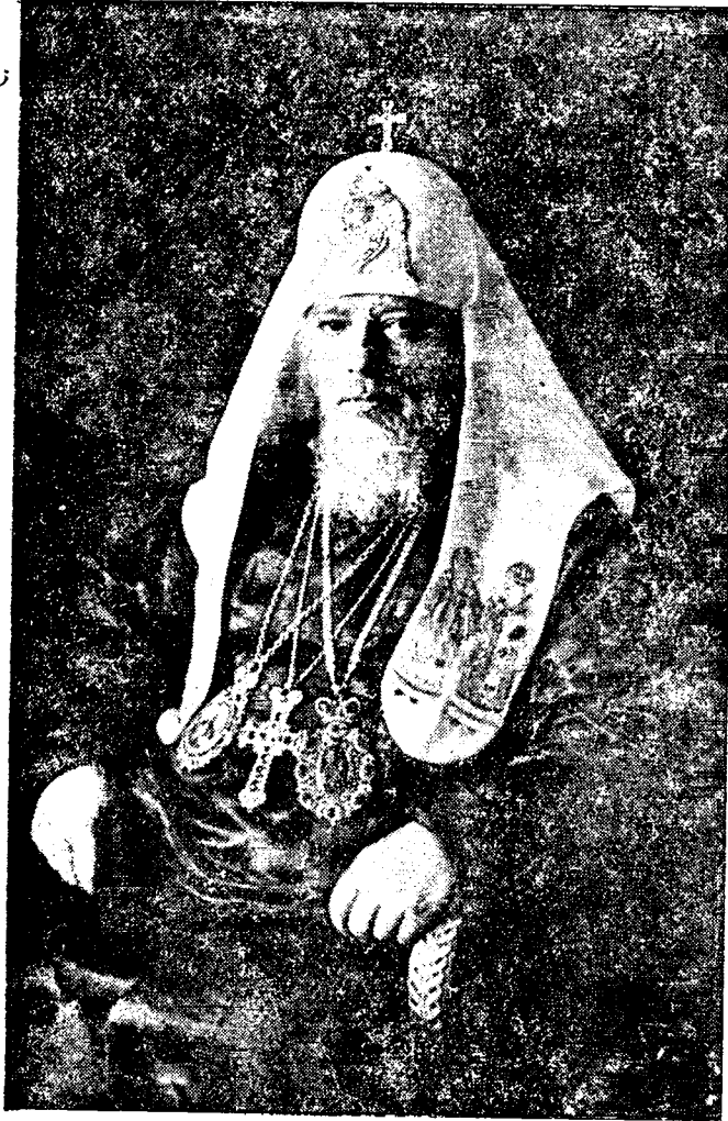
Святейший Патриарх Московский и всея Руси АЛЕКСИИ